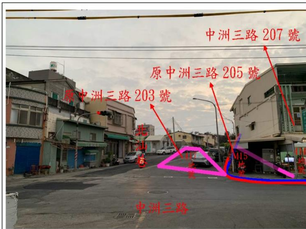
現況說明圖：原 205 號已滅失，僅餘 207 號