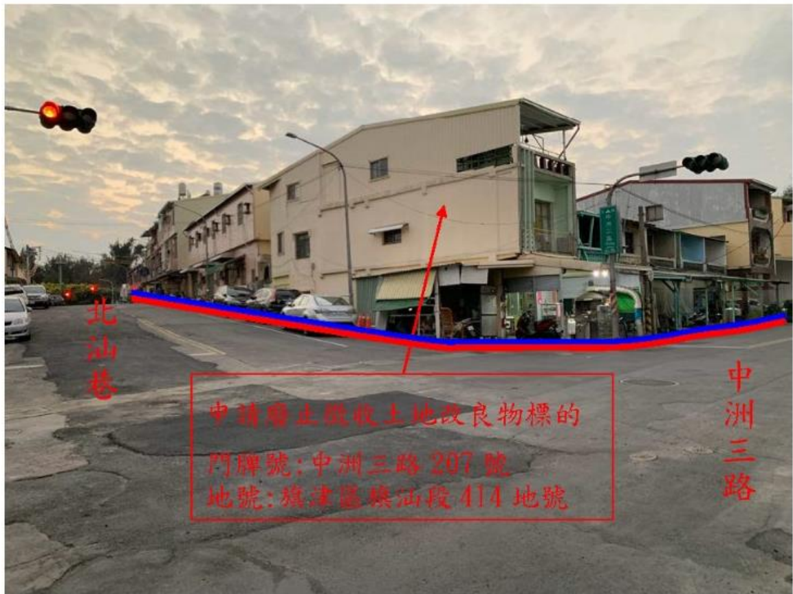
申請廢止徵收土地改良物